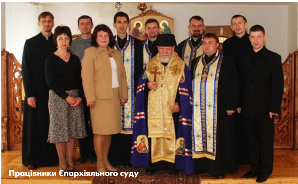
Працівники Єпархіяльного суду